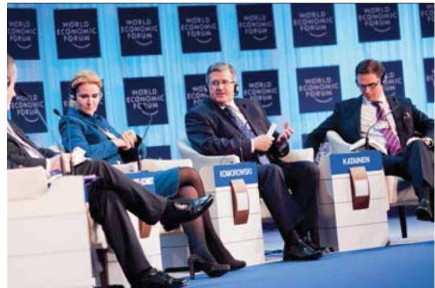
Prezydent RP na Światowym Forum Ekonomicznym w Davos, 26 stycznia 2012 roku