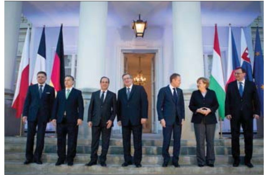
Spotkanie przywódców państw Trójkąta Weimarskiego oraz Grupy Wyszehradzkiej w Warszawie, 6 marca 2013 roku

Prezydent RP dąży do poprawy stosunków polsko-rosyjskich. Tuż przed wizytą Prezydenta Miedwiediewa w Polsce, rosyjski parlament przyjął uchwałę potępiającą zbrodnię katyńską. Za sprawą obydwu prezydentów powstały nowe inicjatywy służące wzmocnieniu współpracy pomiędzy przedsiębiorcami z Polski i Rosji – do spotkań polsko-rosyjskich środowisk biznesowych doszło m.in. podczas Międzynarodowych Targów Poznańskich. Powołano również bliźniacze Centra Polsko-Rosyjskiego Dia-