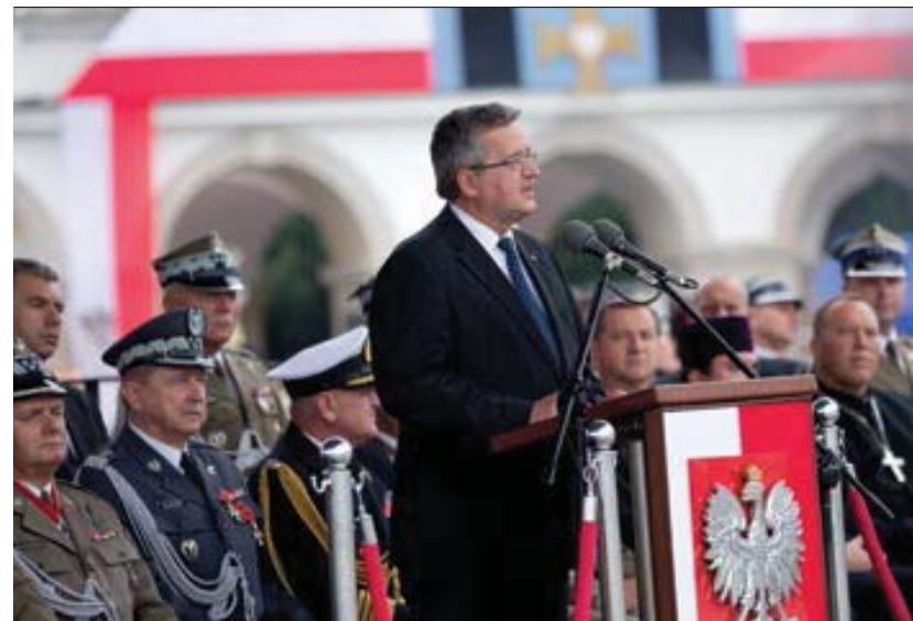
Uroczystości z okazji Święta Wojska Polskiego przed Grobem Nieznanego Żołnierza, 15 sierpnia 2012 roku

We wrześniu 2012 r. Prezydent RP przesłał do Marszałka Sejmu RP projekt ustawy o zmianie ustawy o przebudowie i modernizacji technicznej oraz finansowaniu Sił Zbrojnych Rzeczypospolitej Polskiej, zapewniający finansowanie programu obrony przeciwrakietowej w ramach systemu obrony powietrznej w perspektywie 10 lat. Nowelizacja ustawy została podpisana przez