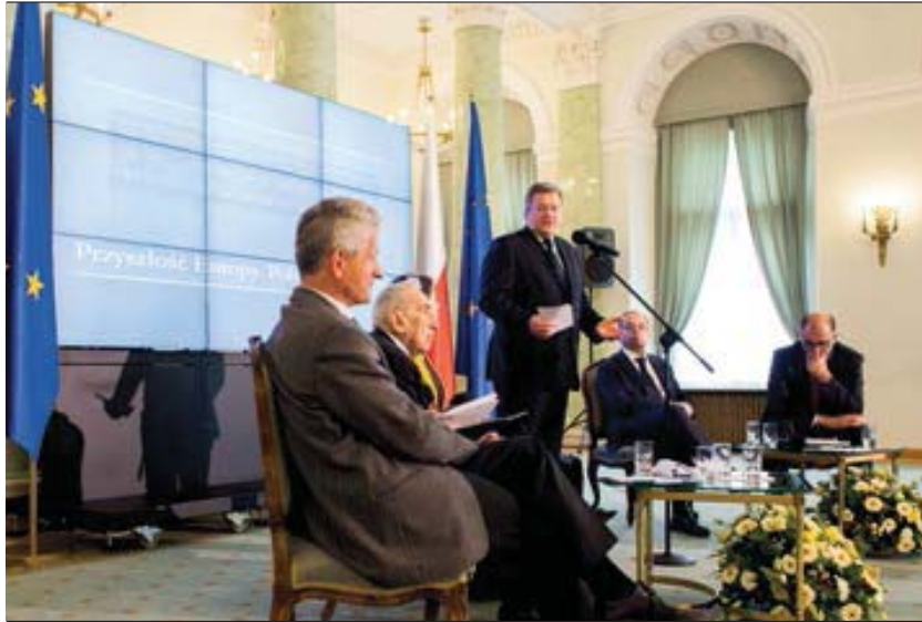
Debata Europejska z cyklu „Przyszłość Europy. Polska perspektywa”, 7 maja 2012 roku

położenie akcentu na politykę spójności może stanowić istotny impuls rozwojowy dla europejskiej gospodarki.