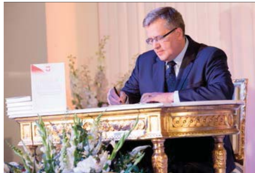
Prezentacja „Białej Księgi Bezpieczeństwa Narodowego RP”, 24 maja 2013 roku

parlamentarnych właściwych w sprawach bezpieczeństwa, przedstawiciele struktur rządowych i pozarządowych, eksperci i analitycy z ośrodków akademickich, byli szefowie BBN. Na początku września 2012 r. przewodniczący Komisji SPBN przedstawił Prezydentowi RP raport z rezultatów jej prac. 8 listopada 2012 r. Rada Bezpieczeństwa Narodowego zaakceptowała jednogłośnie główne wnioski i wyniki Przeządu. Na bazie Raportu Komisji SPBN Biuro Bezpieczeństwa Narodowego opracowało Białą Księgę Bezpieczeństwa Narodowego RP, która została opublikowana 24 maja 2013 r.