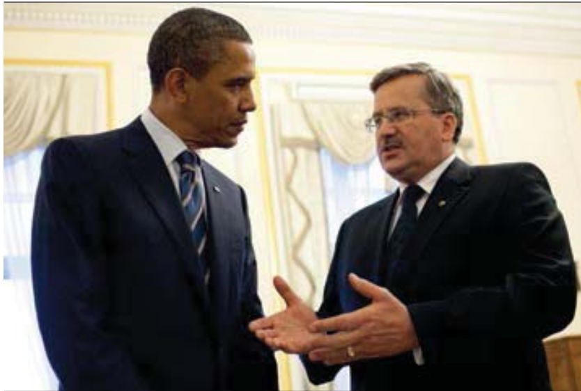
Wizyta Prezydenta Baracka Obamy w Polsce, 27 maja 2011 roku