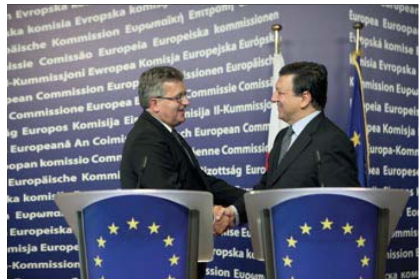
Pierwsza wizyta zagraniczna Prezydenta RP, Bruksela – Paryż – Berlin, 1 września 2010 roku