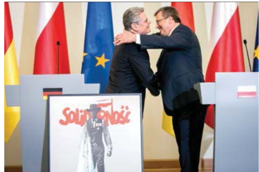
Wizyta Prezydenta Niemiec Joachima Gaucka w Warszawie, 27 marca 2012 roku