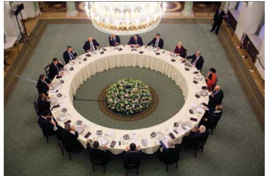
Spotkanie Prezydentów Europy Środkowej w Polsce, 27 maja 2011 roku