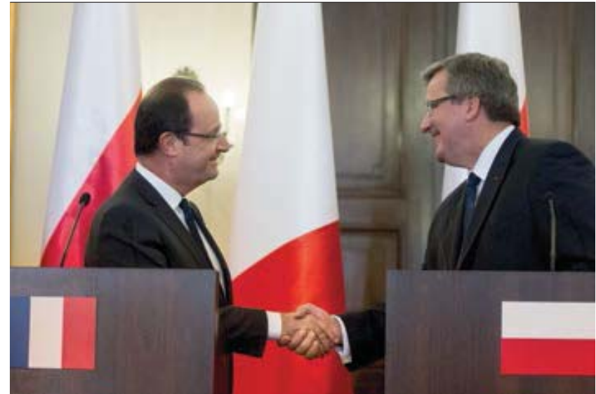
Wspólna konferencja prasowa z Prezydentem Francji François Hollande’em, Warszawa, 16 listopada 2012 roku

Polska upatruje szans na przezwyciężenie obecnego kryzysu w poszerzaniu i pogłębianiu integracji europejskiej. Tym przekonaniom prezydent dawał wyraz zarówno w przemówieniu w Parlamencie Europejskim w Strasburgu we wrześniu 2011 r., jak i w czasie licznych wizyt bilateralnych w państwach Unii Europejskiej. Przyszłość Unii Europejskiej była także przedmiotem rozmów podczas wizyty w Belgii w listopadzie 2012 r. W trakcie licznych spotkań, m.in. z szefem Rady Europejskiej Hermanem Van Rompuyem, Bronisław Komorowski podkreślał znaczenie polityki spójności dla budowania pozytywnej przyszłości UE. Temat ten towarzyszył także rozmowom w trakcie pierwszej wizyty Prezydenta Francji w listopadzie 2012 r. w Warszawie. Podczas rozmów omawiano sytuację w Unii Europejskiej i negocjacje budżetu na lata 2014-2020. Prezydent Komorowski przekonywał Prezydenta Hollande’a, że postulowane przez Polskę