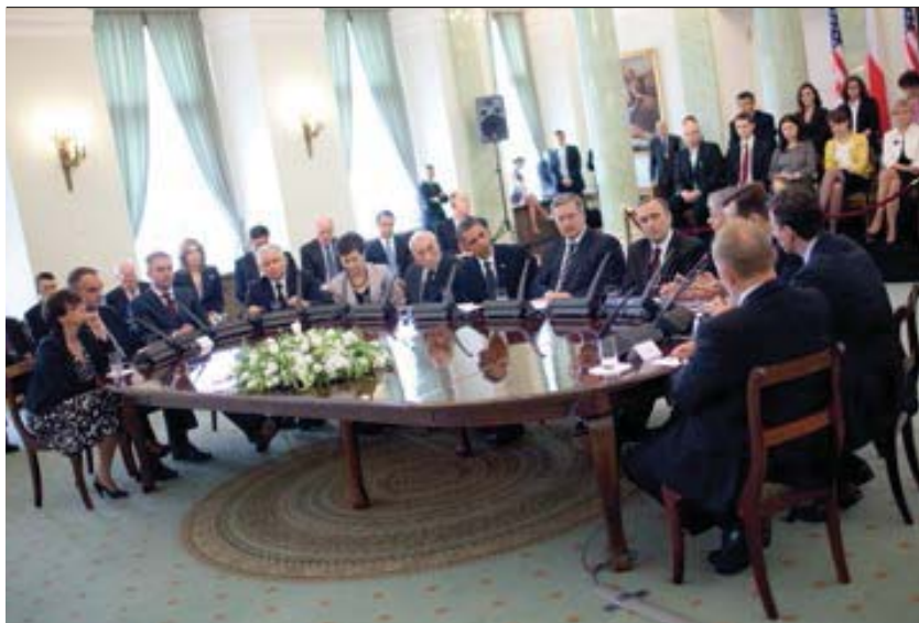
Wizyta Prezydenta Baracka Obamy w Polsce – „Spotkanie z Polską Demokracją”, 28 maja 2011 roku