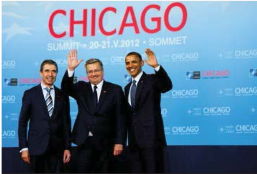
Prezydent RP na Szczytcie NATO w Chicago, 20-22 maja 2012 roku