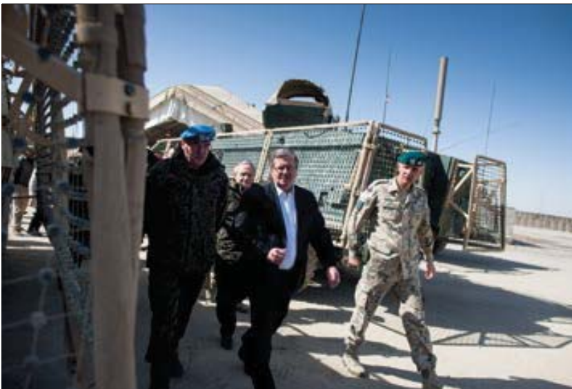
Spotkanie z żołnierzami 10. Zmiany Polskiego Kontyngentu Wojskowego, 6 marca 2012 roku

” Zależało nam na jednoznacznym zakończeniu misji w Afganistanie z udziałem polskich żołnierzy i niepodjęciu decyzji, które wiązałyby nam ręce jeśli chodzi o przyszłość zaangażowania Sojuszu w Afganistanie.