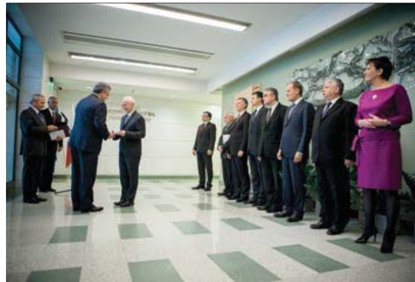
Posiedzenie Rady Bezpieczeństwa Narodowego, 12 września 2012 roku

Celem tego nowatorskiego przedsięwzięcia była całościowa ocena stanu bezpieczeństwa narodowego oraz sformułowanie wniosków dotyczących strategicznych celów i sposobów działania państwa w dziedzinie bezpieczeństwa oraz przygotowania systemu bezpieczeństwa narodowego. Prezydent Bronisław Komorowski wystąpił z inicjatywą przeprowadzenia przeglądu 15 sierpnia 2010 r. uznając, że w coraz bardziej złożonej strukturze bezpieczeństwa i w związ-