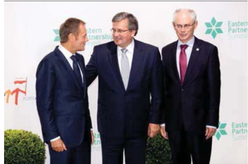
Szczyt Partnerstwa Wschodniego w Warszawie, 29 września 2011 roku

Prezydent Bronisław Komorowski wysoko ceni spotkania w ramach Grupy Wyszehradzkiej. Z prezydentami Czech, Węgier i Słowacji Prezydent RP spotykał się wielokrotnie, m.in. w listopadzie 2010 r. w czeskich Karlowych Warach, gdzie m.in. potwierdzono zgodność poglądów w sprawie nowej koncepcji strategicznej NATO, w październiku 2011 r. w Budapeszcie z okazji 20. rocznicy powstania Grupy Wyszehradzkiej oraz na początku maja 2012 r. na Słowacji (bez udziału nowo wybranego prezydenta Węgier). Spotkania czterostronne były uzupełniane częstymi wizytami bilateralnymi.